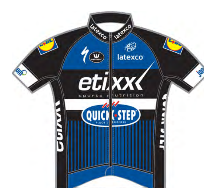
ETIXX - Quick Step (BEL)