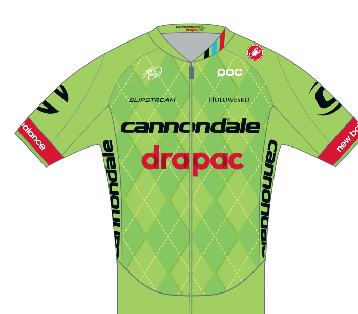
Cannondale-Drpac Pro Cycling Team (USA)