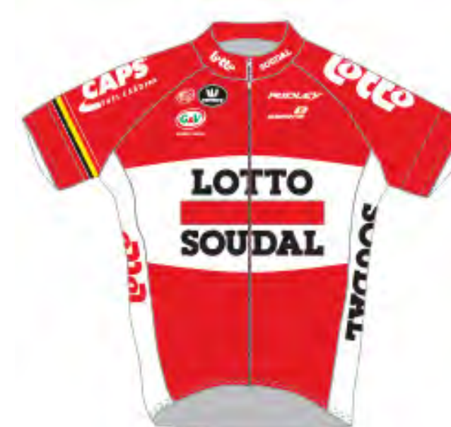
Lotto Soudal (BEL)