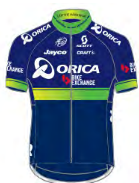
ORICA - BikeExchange (AUS)