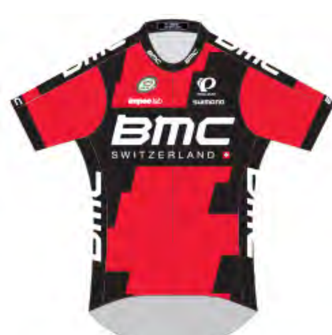
BMC Racing Team (USA)