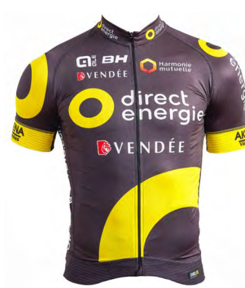
Team Direct Énergie (FRA)