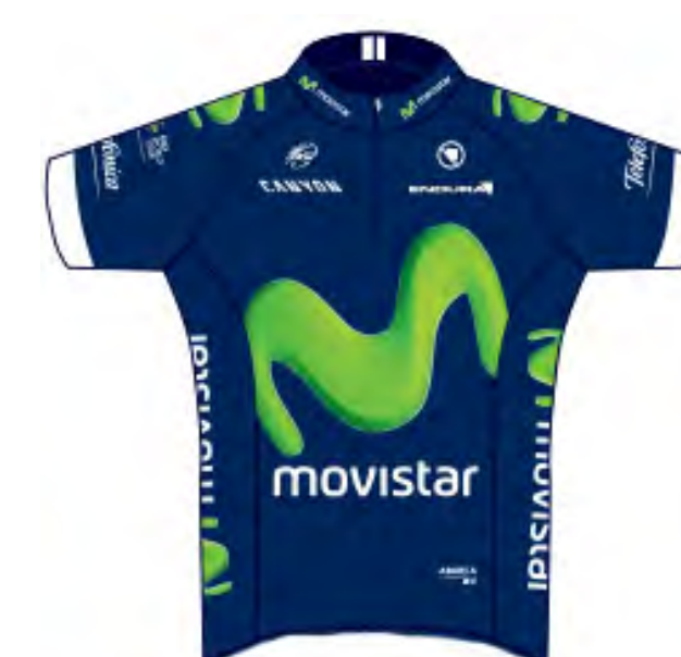
Movistar Team (ESP)