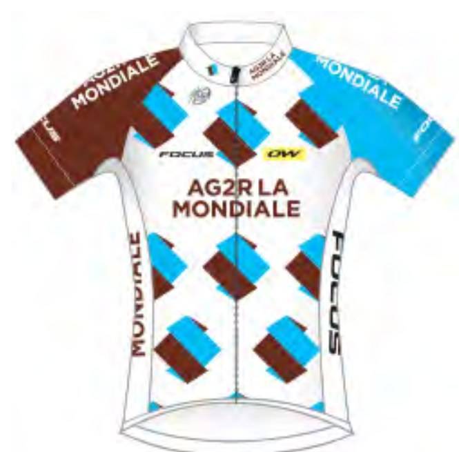
AG2R La Mondiale (FRA)