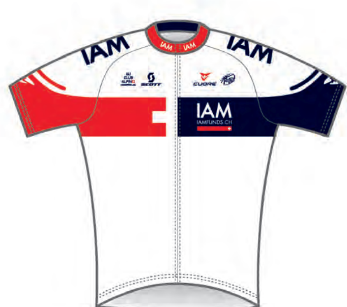
IAM Cycling (SUI)