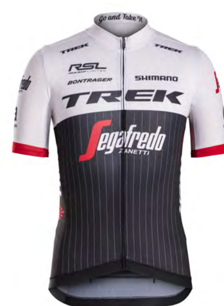
Trek - Segafredo (USA)