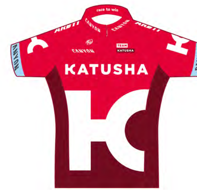
Team Katusha (RUS)