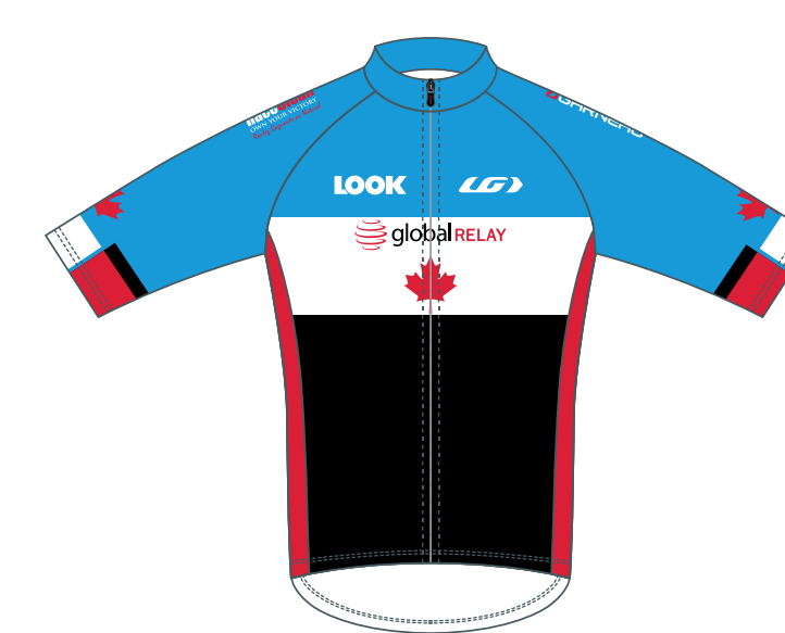
Équipe canadienne (CAN)