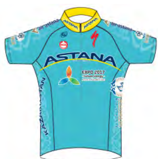
Astana Pro Team (KAZ)