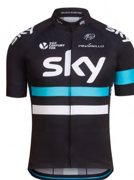
Team Sky (GBR)