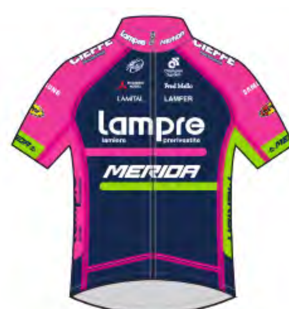
Lampre - Merida (ITA)