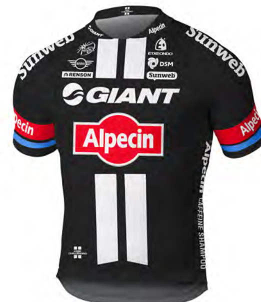
Team Giant - Alpecin (GER)