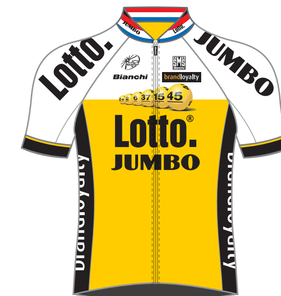
Team Lotto NL - Jumbo (NED)