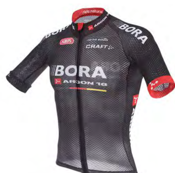
Bora-Argon 18 (GER)