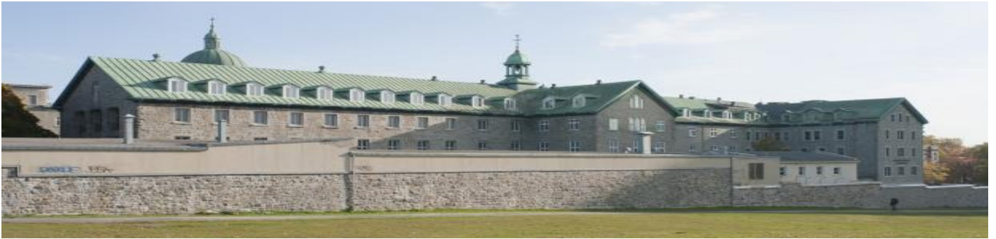
L'ensemble du couvent des Religieuses Hospitalières de Saint-Joseph et de l'Hôtel-Dieu, avec son dôme, son site clos et ses jardins.

Un musée unique qui, en plus de retracer l'histoire de la santé et du patrimoine sacré, évoque les véritables origines de Ville-Marie. On y explore la fondation de Montréal et de l'Hôtel-Dieu à travers l'histoire de la médecine de l'époque et celle des Hospitalières de Saint-Joseph dans leur mission auprès des malades.