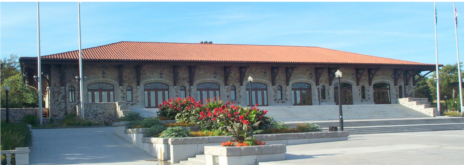
Chalet du Mont-Royal. Crédit photo : Sylvie Giroux, 2002