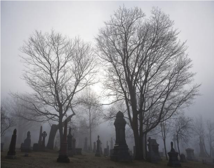
Le cimetière Mont-Royal fait partie des sept lieux historiques nationaux situés sur la montagne.

Fondée en 1878, l'Université de Montréal compte aujourd'hui 13 facultés et forme avec ses deux écoles affiliées, le premier pôle d'enseignement supérieur et de recherche du Québec, le deuxième au Canada et l'un des plus importants en Amérique du Nord. Complété en 1943, le pavillon principal, de style Art déco, est l'oeuvre de l'architecte Ernest Cormier.