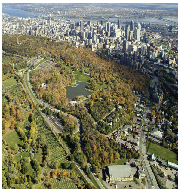
Le Mont-Royal.