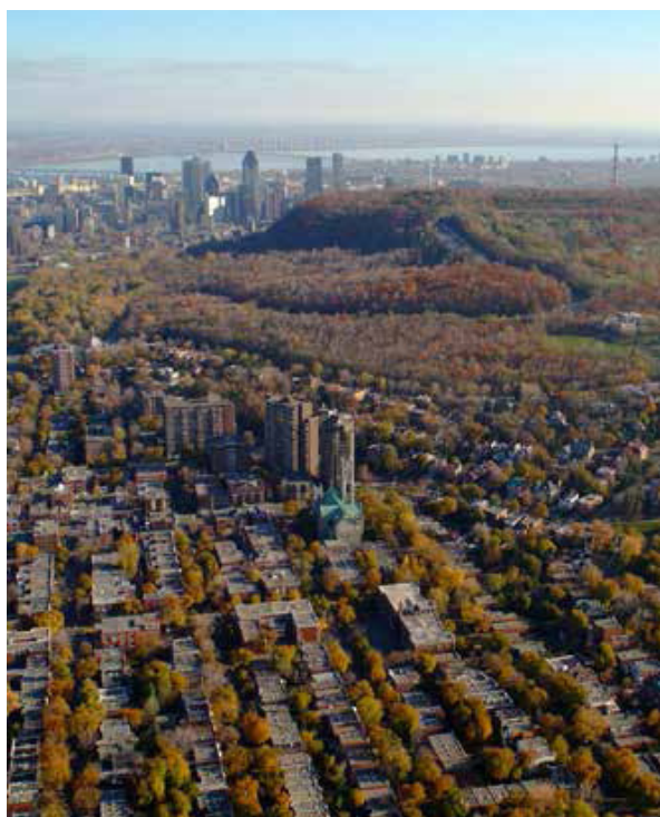
Le Mont-Royal.

Érigée en 1924, la croix du Mont-Royal rappelle que le 6 janvier 1643, Maisonneuve, fondateur de Montréal, tint sa promesse de planter une croix de bois sur le mont Royal si la jeune colonie survivait à la menace des inondations. Haute de 30 mètres, la croix s'illumine le soir.