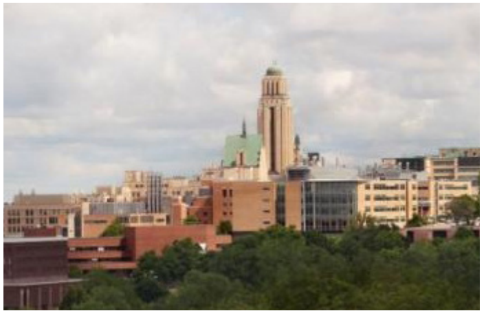
Une vue du campus de l'Université de Montréal à partir de la montagne.